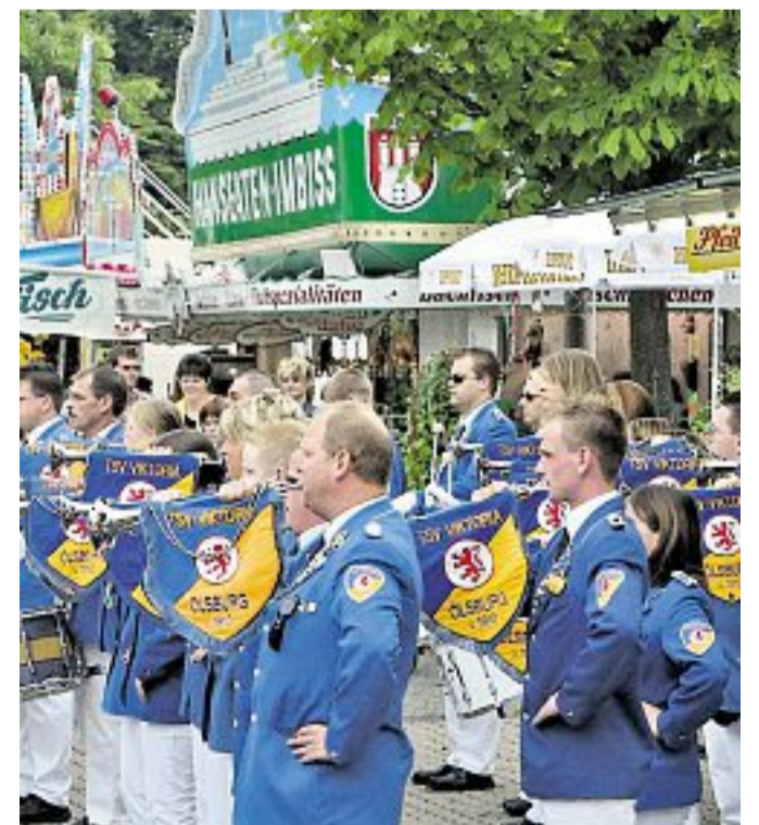
Die Ölsburger Fanfaren: Konzert des Fanfarenzugs auf dem Peiner Rummelplatz.