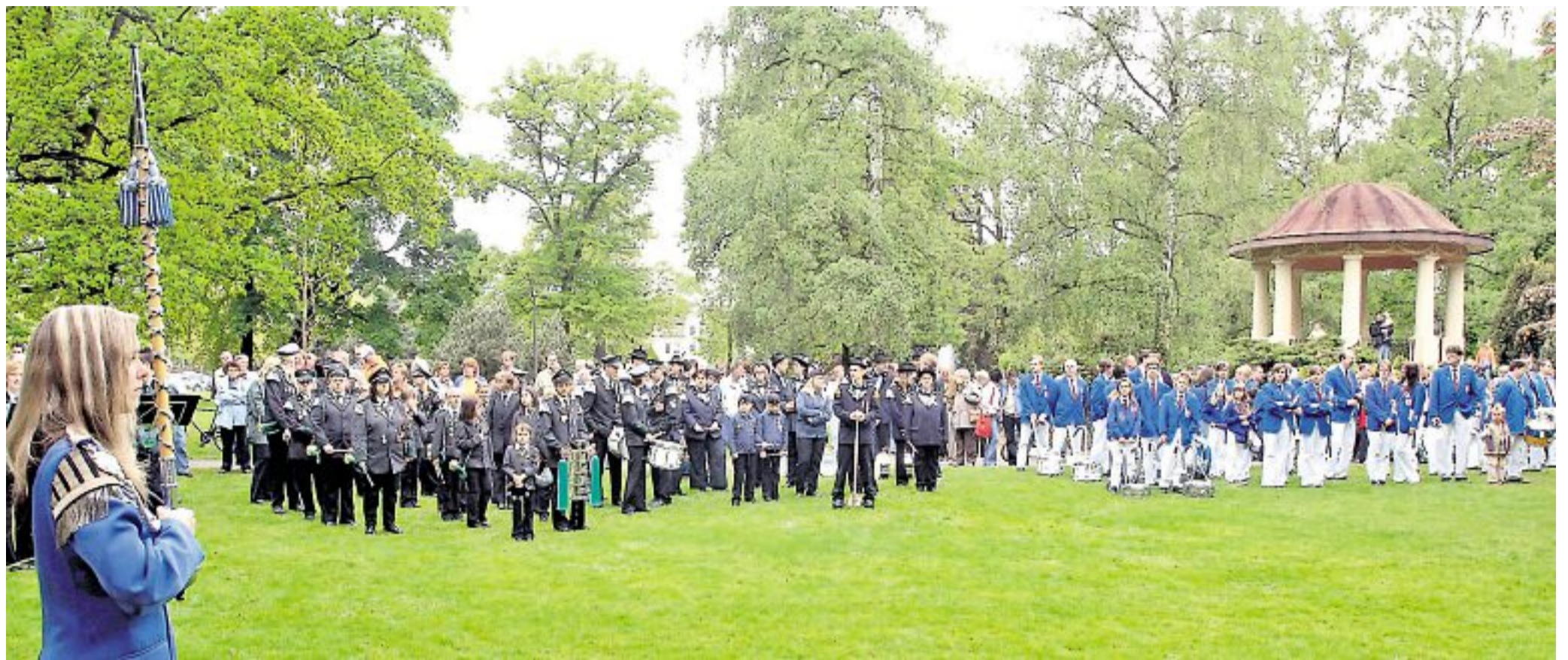
Stadtkonzert: Auftakt der Saison für die Spielmanns- und Hörnerzüge sowie den Fanfarenzug Ölsburg. Richtig rund geht es dann beim Peiner Freischießen.