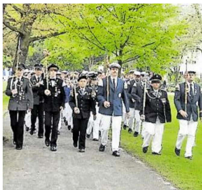
Aufmarsch im Stadtpark: In diesem Jahr findet das Muttertagskonzert allerdings auf dem Marktplatz statt.