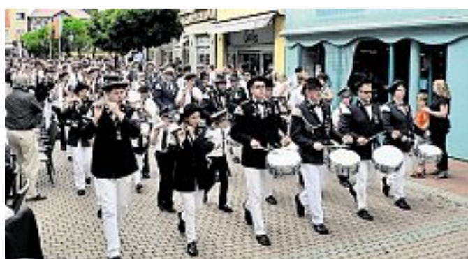
Freischießen-Umzug: Der Spielmannszug des Peiner Walzwerker Vereins in der Fußgängerzone.